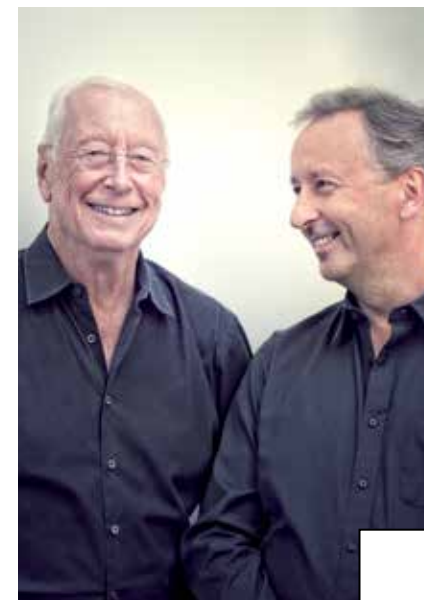
William Christie directeur musical fondateur Paul Agnew directeur musical adjoint

Fidèles à l'interprétation sur instruments anciens, Les Arts Florissants ont joué un rôle pionnier dans la redécouverte et la diffusion de la musique européenne des XVII e et XVIII e siècles, qu'ils s'attachent à faire redécouvrir dans toute son actualité.